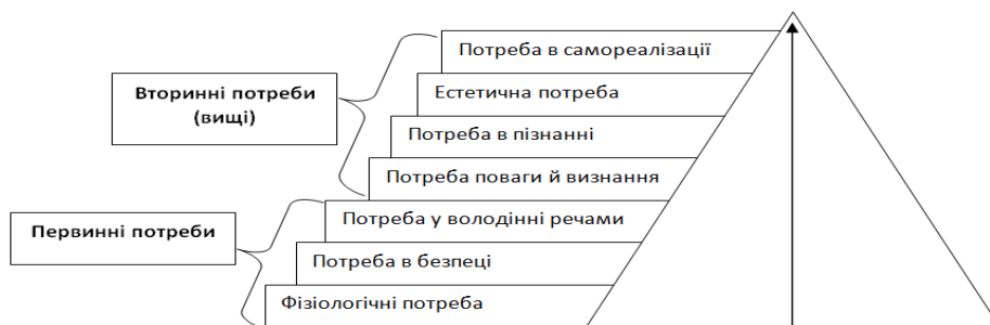
Піраміда потреб людини (за А. Маслоу)

8. Розгляньте рисунок, на якому зображена так звана «піраміда потреб людини» (за А. Маслоу) й визначте, яку з потреб керівники (роботодавці), згадані в текстах А й Б , намагаються забезпечити в умовах недовіри методу «батога й пряника».