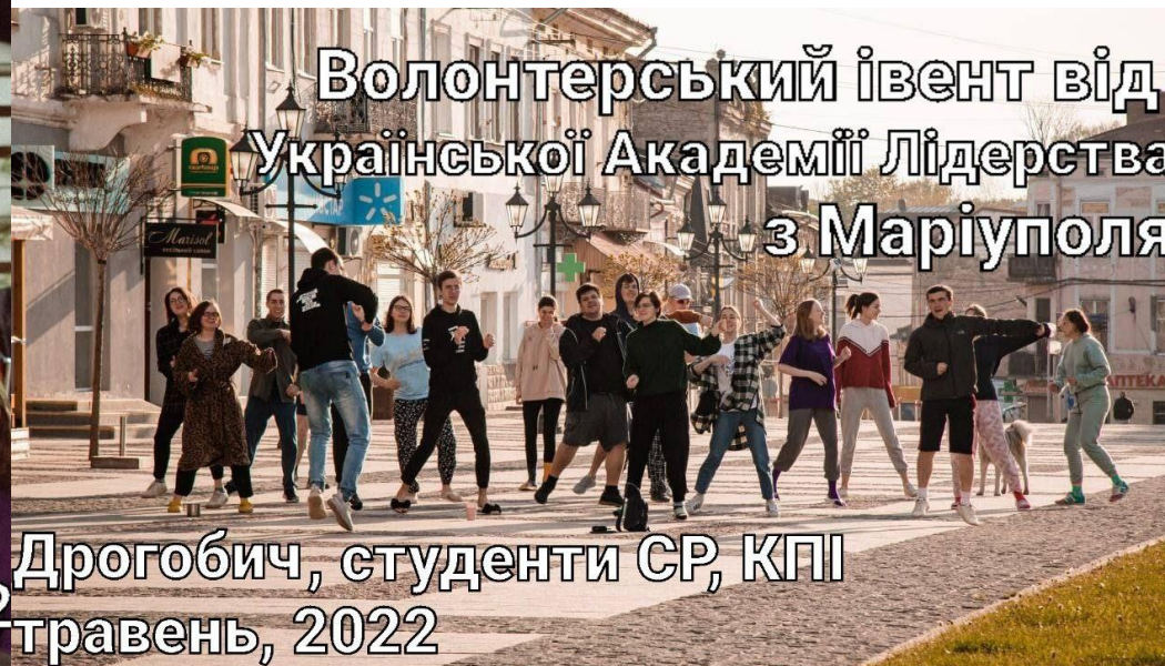
Дрогобич, студенти СР, КПІ травень, 2022