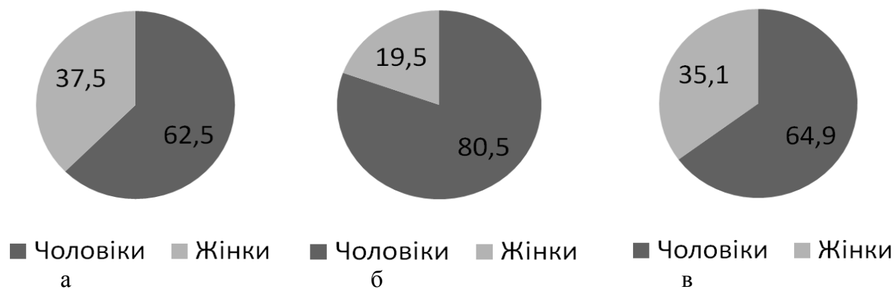
Рис. 1. Співвідношення координаторів проектів у міжнародних програмах, у відсотках: а – у програмі «Еразмус+» від КПІ ім. Ігоря Сікорського, б – у програмі «Горизонт 2020» від КПІ ім. Ігоря Сікорського, в – загалом у програмі «Горизонт 2020»

Проаналізувавши міжнародні проекти, подані КПІ ім. Ігоря Сікорського за період з 2008 до 2018 років, визначили співвідношення чоловіків та жінок серед координаторів проектів [5]. За результатами досліджень отримали підтвердження того, що переважна більшість керівників – чоловіки. На рис. 1 зображено співвідношення координаторів-жінок до координаторів-чоловіків у міжнародних програмах, у відсотках.